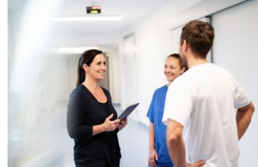
Lernen Sie Ihr Team kennen!

Lassen Sie uns gemeinsam Erfolgsgeschichte schreiben!