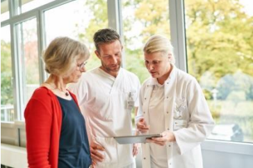
Ihre Perspektiven bei uns!