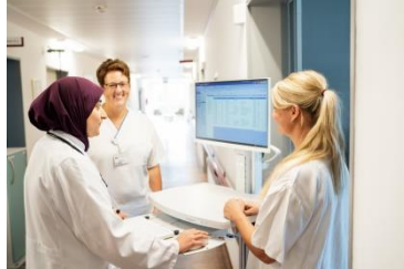
Was uns ausmacht!