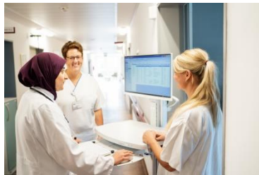
Was uns ausmacht!