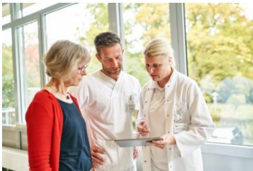
Ihre Perspektiven bei uns!