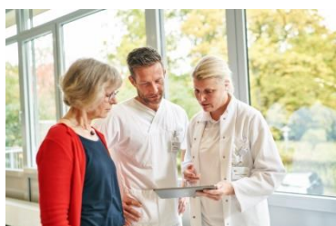
Ihre Perspektiven bei uns!