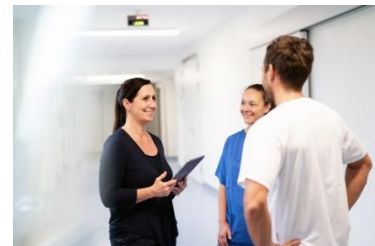
Lerne das Team kennen!

Lass uns gemeinsam Erfolgsgeschichte schreiben!